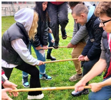
*Kennenlerntag der Integrations-Vorklasse

Schüler*innen, die ihren Wohnsitz nicht in Nürnberg haben, müssen im Anschluss an die Integrations-Vorklasse an eine nähergelegene Fachoberschule wechseln, wenn sie eine Fahrtkostenerstattung in Anspruch nehmen wollen.