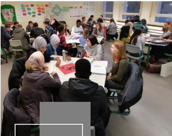
*Beratung der Integrations-Vorklasse durch Schüler*innen der 12. Klassen

Die Integrations-Vorklasse bereitet dabei auf die Fachoberschule vor. Außerdem unterstützen wir unsere Schüler*innen dabei einen deutschen mittleren Schulabschluss als externe Teilnehmer*innen an einer Mittelschule abzulegen.