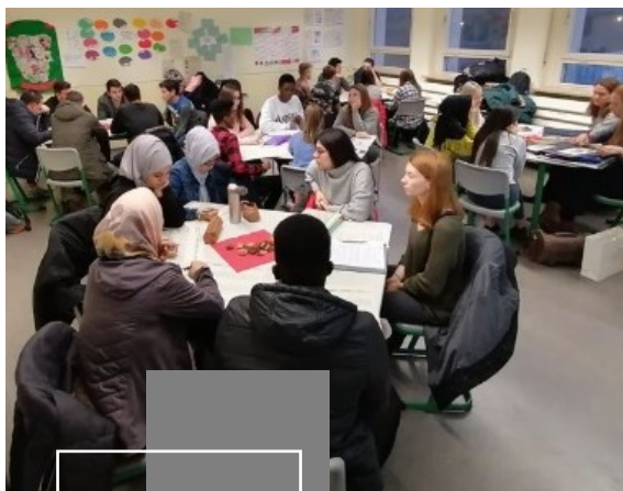
*Beratung der Integrations-Vorklasse durch Schülerinnen und Schülern der 12. Klassen

Die Integrations-Vorklasse bereitet dabei auf die Fachoberschule vor. Mit dem erfolgreichen Durchlaufen der Integrations-Vorklasse wird ein mittlerer Schulabschluss erworben.